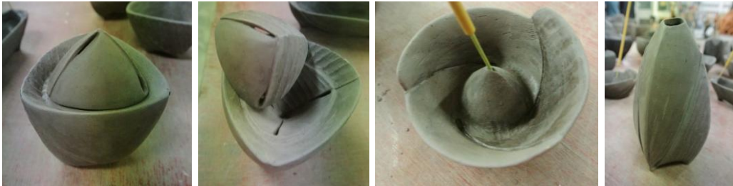
แบบร่าง 3 มิติ