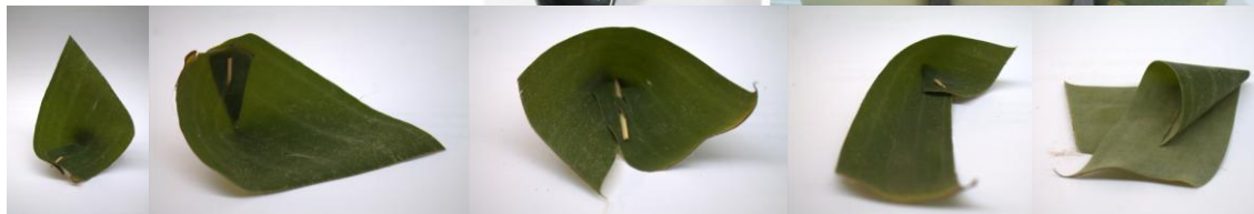
การศึกษารูปทรงที่เกิดจากการม้วน ซ้อน ทับใบตอง