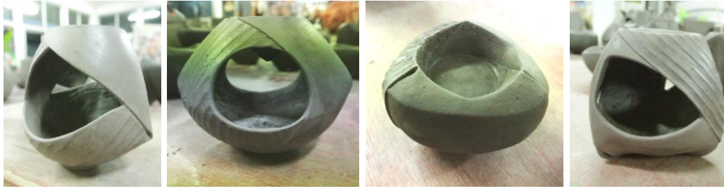
แบบร่าง 3 มิติ