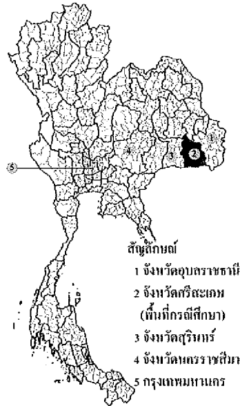
ภาพที่ 1 แสดงลักษณะพื้นที่ศึกษา

กำหนดพื้นที่การศึกษา คือ บ้านโนนสำโรง ตำบลกล้วยกว้าง อำเภอห้วยทับทัน จังหวัดศรีสะเกษ